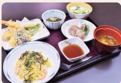
誕生日メニューの一例です

四季折々の食材を活かしてご利用様の身体状况に合わせた食事(キザミ食・ムース食)を提供いたします。